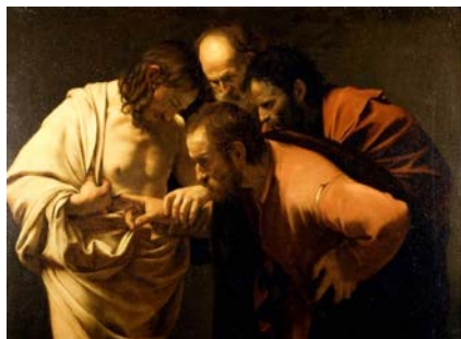
Foto: "Der ungläubige Thomas" Caraveggio gemeinfrei via Wikimedia commons